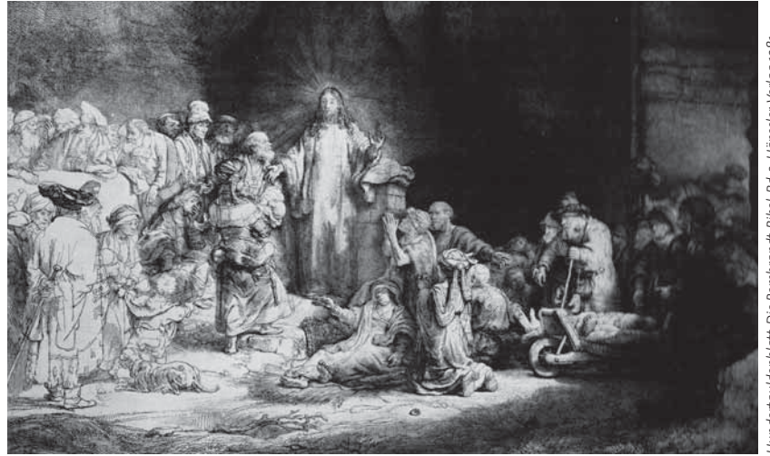
Hundertguldenblatt, Die Rembrandt-Bibel, Bd. 2, Hänssler-Verlag 1981