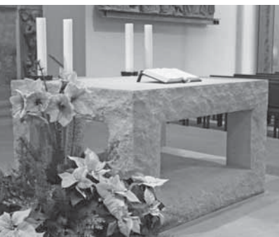
Altar der Stiftskirche Stuttgart